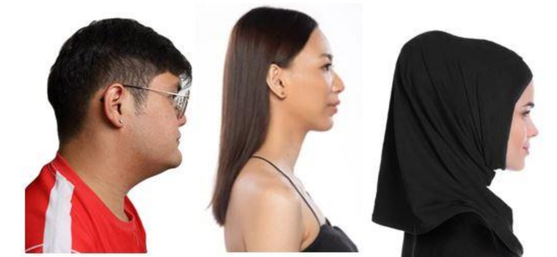
Example: Right side facing / หันข้างด้านขวา