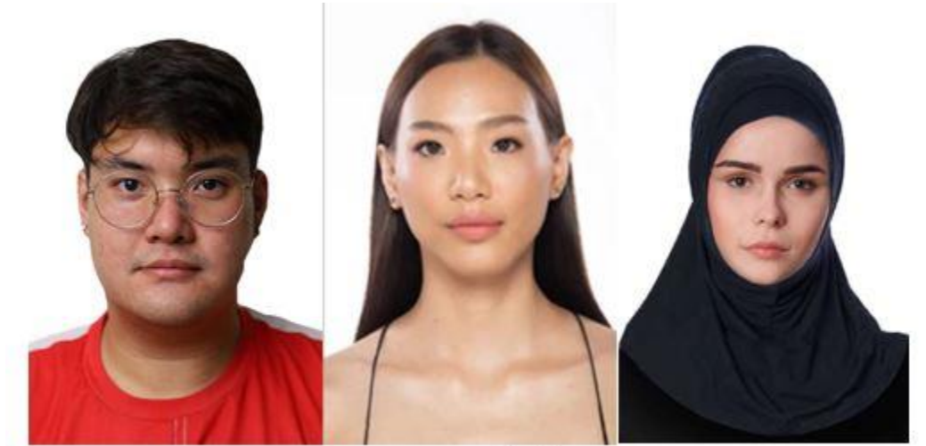
Example: Straight facing/หันหน้าตรง